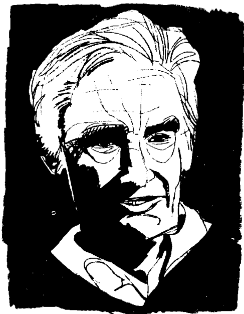
هوارد زین (۱۹۲۲ - ۲۰۱۰)