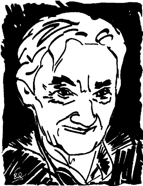
هوارد زین (۱۹۲۲ - ۲۰۱۰)