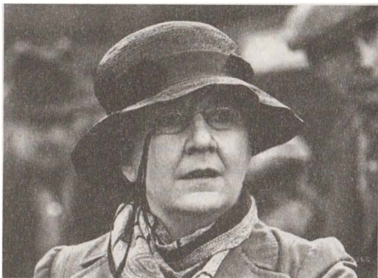
ایما غولدمان (۱۸۶۹ - ۱۹۴۰)