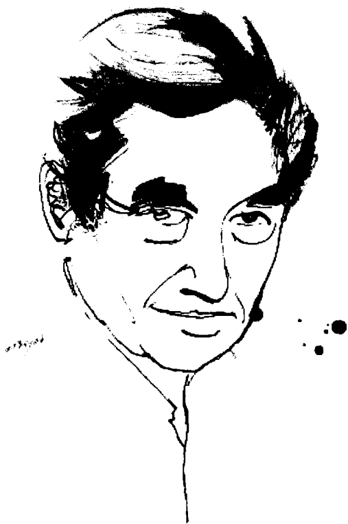
هوارد زین (۱۹۲۲ - ۲۰۱۰)