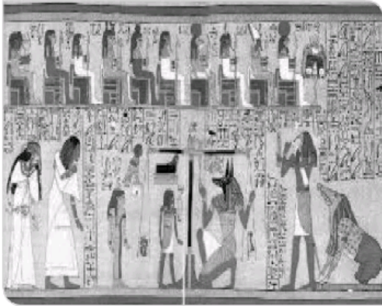
لوحة من لوحات بردية «الخروج إلى النهار»