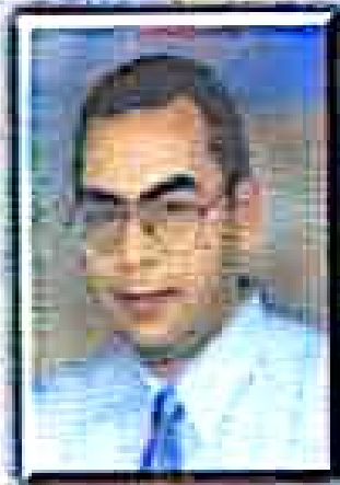
د. احمد خالد توفيق

انت تعرف هؤلاء الذين يهيمنون في الردهات ليلاً .. الذين يستحيل أن تري وجوههم .. الذين يمشون في الظلال .. الذين لا يستديرون للوراء أبداً .. الذين يختفون فجأة ويعودون من حيث جاءوا !