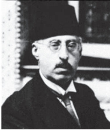
الأمير شكيب أرسلان

بتغييرها، وكيفية تأسيس الدول، وما تدخل فيه من الأطوار وتنوع المدنيات وعوامل نموها أو تقلصها، كل ذلك كان من المباحث التي خاض فيها إلى أقصى ما يمكن الخوض فيه، وذلك في مقدمته المشهورة "Prolegomenes" ولم نجد في أوروبا — إلا في القرن الثامن عشر للمسيح — أناساً حاولوا أن يستخرجوا أسرار التاريخ استخراجاً بعد أن كانت أقفلاً مستحجبة تعذر فتحها، فكان ابن خلدون في العقل والإدراك من فضيلة «مونتسكيو Montesquien» أو الأب «مابلي Mably» وهو من دون شك الجد الأعلى لعلمائنا الاجتماعيين المحدثين مثل «تارد Tarde» أو المستشرق «غوبينو Gobineau» هـ.