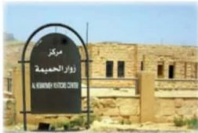
الحميمة مركز الدعوة السرية

ولكن من هي الأفعى الرمزية في خراسان وحقيقتها؟