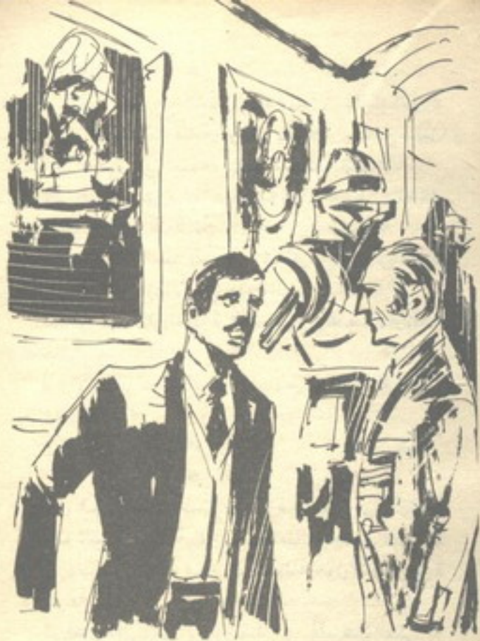
اقنادنا رئيس الخدم في كبرياء ، عبر دهليز طويل تحف به الصور الزيتية القديمة ، ودروع الفرسان الواقفة ممسكة برماحها ..

لقمة مجهوداً لا يستهان به ، وكانت (ماجى) ودوداً إلى حد مرعب ، وتثرثر طيلة الوقت ، لكنى كنت غارفاً فى مشاكلية الخاصة ، مع آداب العاندة كى لا يبدو لهؤلاء السادة المتحذلقين فظاً ومتوحشاً .. لهذا كنت أرد عليها بإيماءات متكللة معناها أن كلامها ممل جداً ..