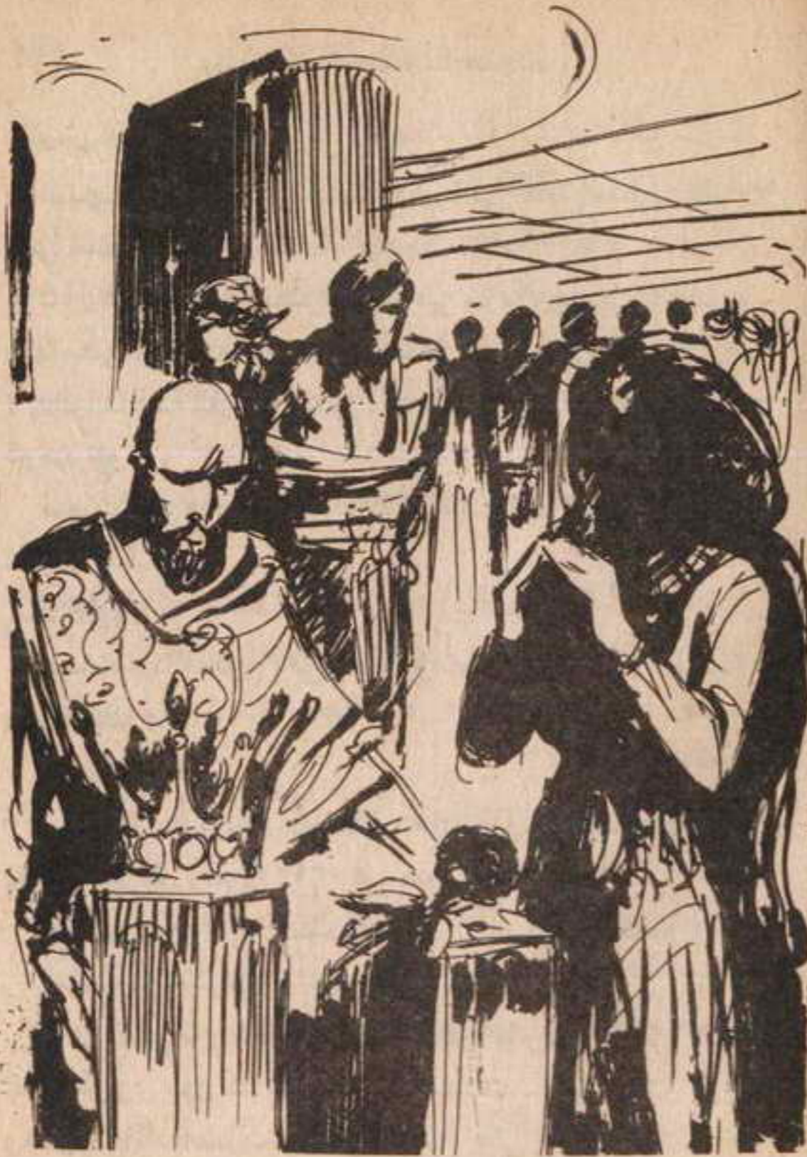
فارتفعت اسطوانة أخرى ، تحمل على قممها تاج من الذهب ..

لم يتم عبارته ، فهتفت به ( سلوى ) ، في صوت خافت :