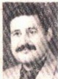
د. نبيل فاروق