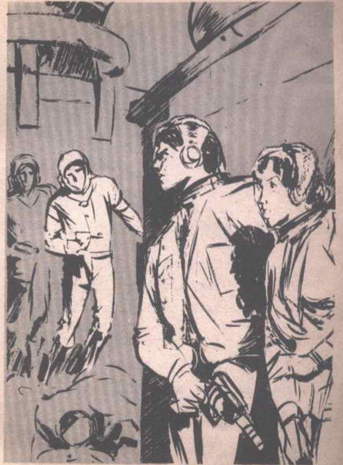
أجابها بهدوء ، وهو يختلس النظر إلى حيث يزحف الرجلان الباقيان نحوهما ..

— سنزحف بجوار هذا الحاجز الرصاصي ؛ لنبتعد عن النقطة التي يضعون خططهم لمهاجمتنا فيها ، ثم نباغتهم بدورنا .