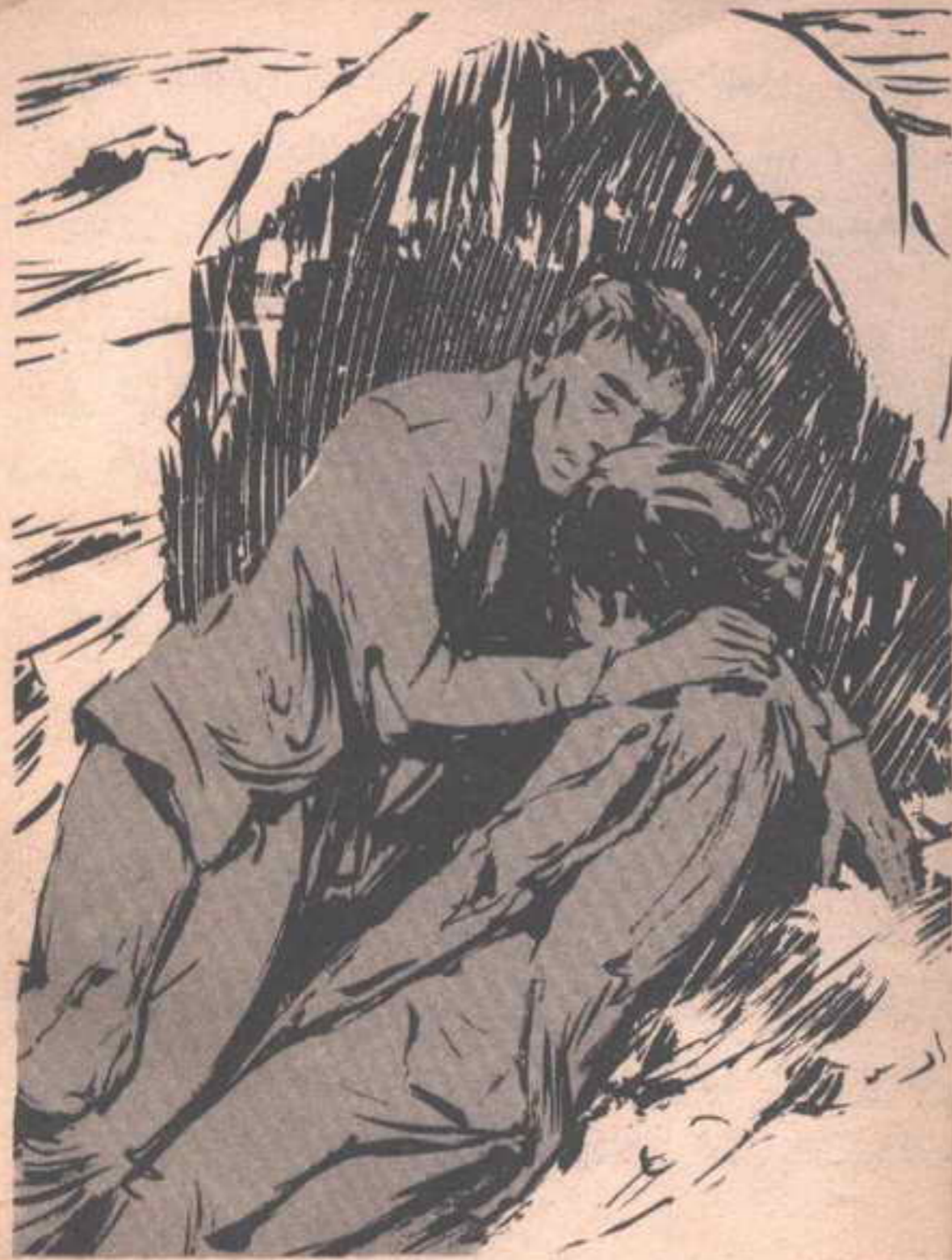
فوضع رفيقته تحتها ، بحيث تغطيها الظلال ، ثم تهالك بجوارها ، وعاد يمسح عرقه الغزير ..

رفيقته ، وخوفه العارم من ذلك العدو المجهول الذي يطارده ..