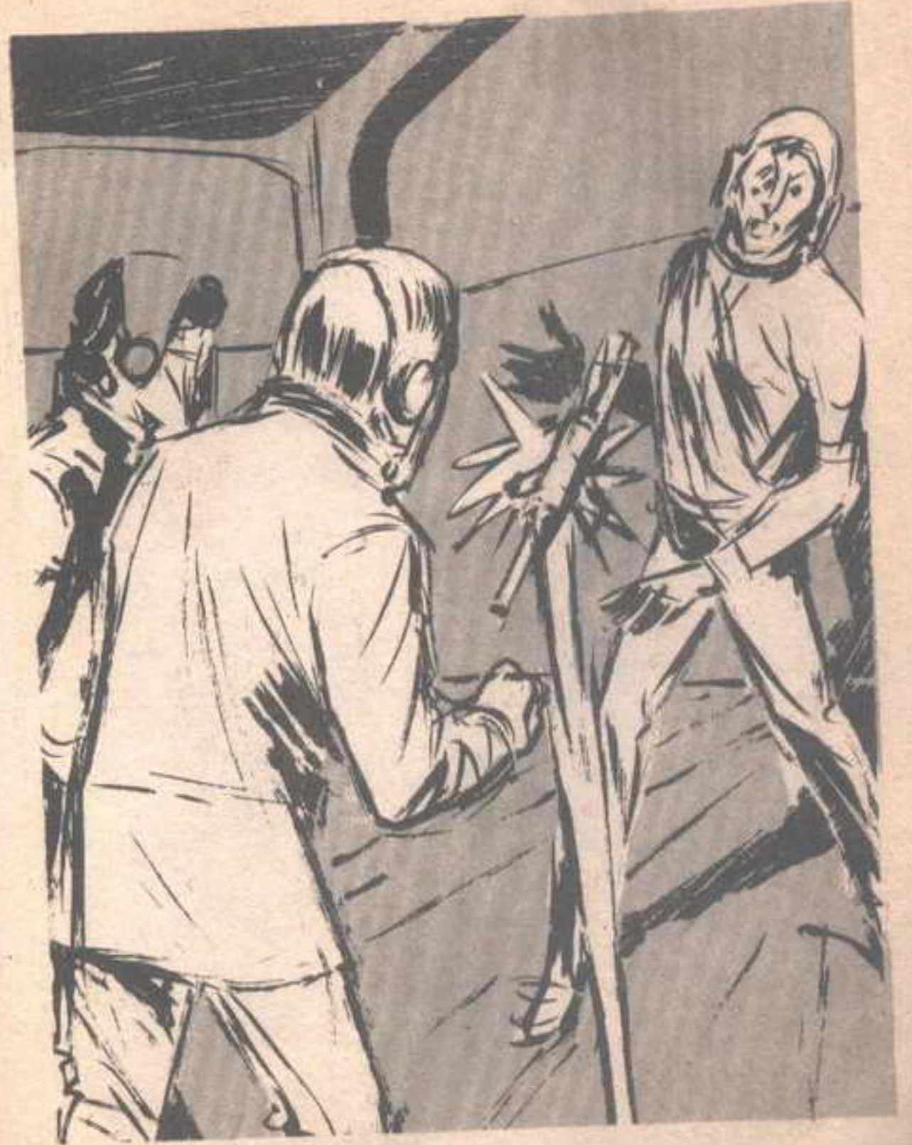
فى نفس اللحظة التى مرق فيها شعاع من الليزر عبر الغرفة ، وأصاب البندقية التى يحملها الغازى ..