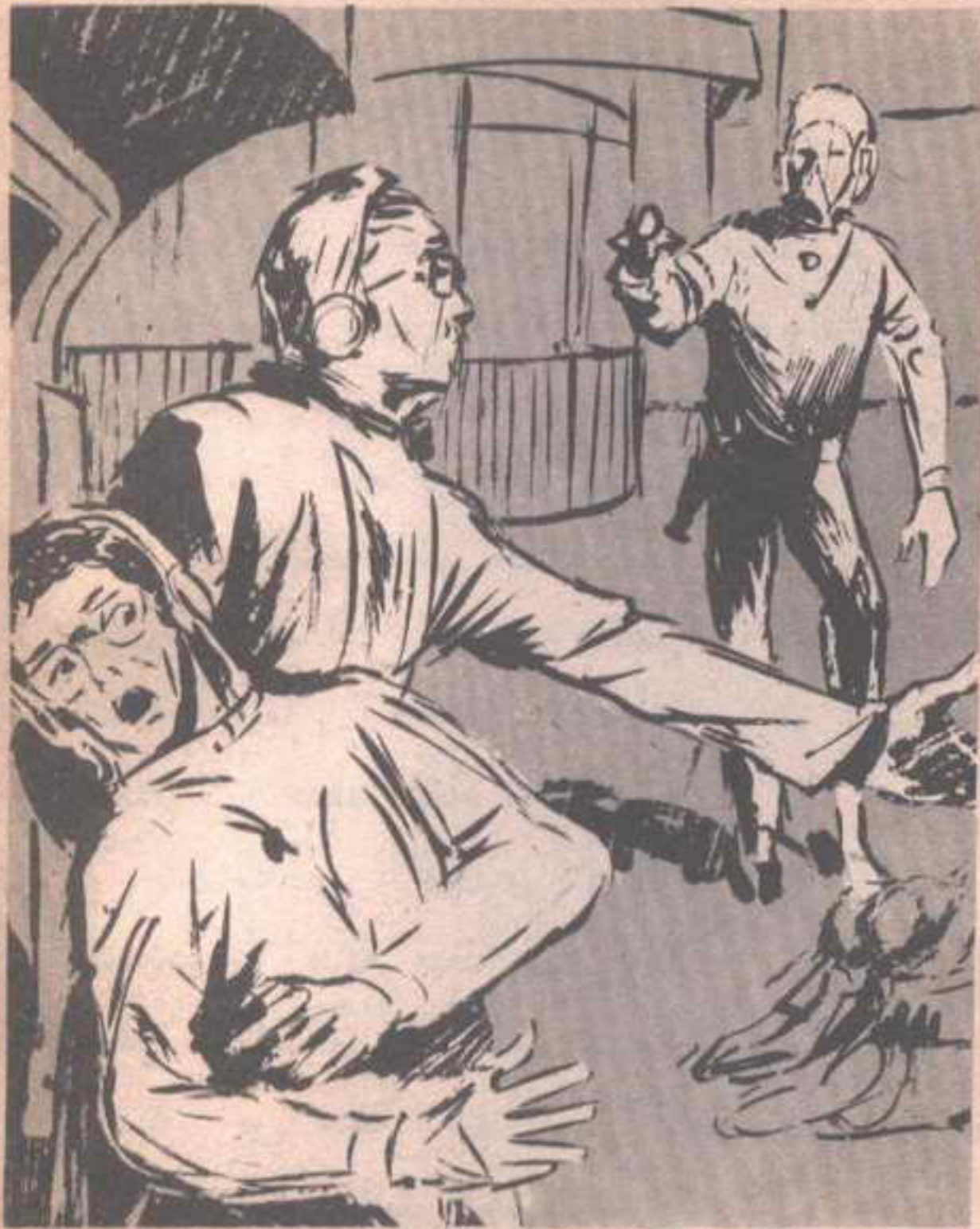
وقبل أن يكمل ( محمود ) عبارته ، شق الهواء شعاع من الليزر الأزرق ، أصاب ذراعه اليمنى ..