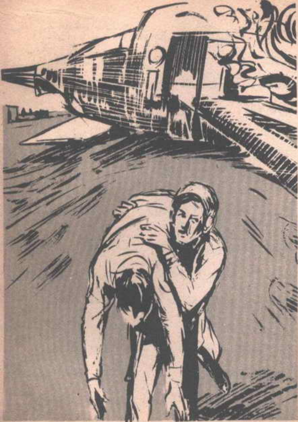
فأسرع يقفز من الطوافة ، حاملاً الطيار على كتفه ، وأخذ يعدو بحمله ، محاولاً الابتعاد بقدر الإمكان ..

— أسرعوا بالهرب من باب الطوارئ .. ستفجر هذه الطوافة ما بين لحظة وأخرى .