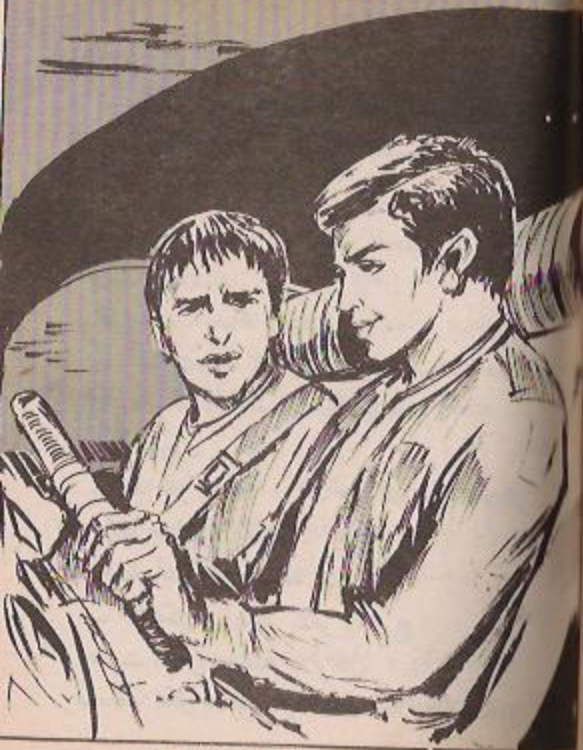
أجاب (نور) : «سعود إلى الفندق في مدينة السويس» ..