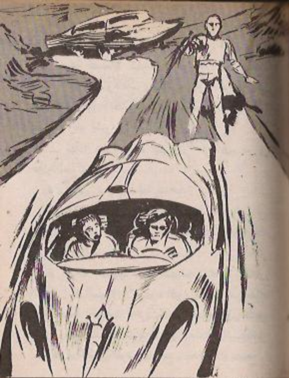
وأطلق الرجل طلقة من مسدس الليزر الذي يمسكه بيده ..

يقف سوى ( نور ) ، الذي قفز محاولاً أخذ مكانه أمام عجلة قيادة السيارة ، وأطلق الرجل طلقة من مسدس الليزر الذي يمسكه بيده ، ولكنها أصابت الرمال بجوار السيارة ..