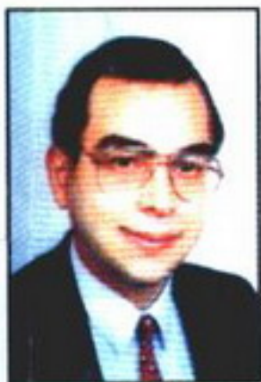
د. احمد خالد توفيق