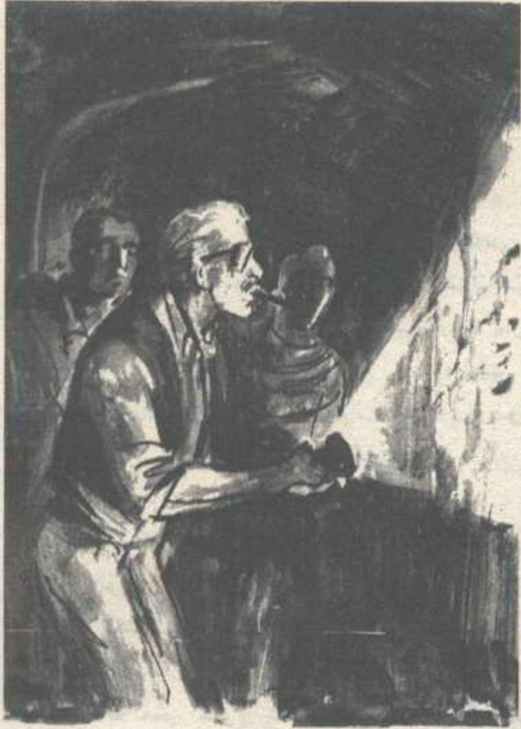
ثمة علامات على بعض أجزاء الجدار .. كأنما هناك يد قد رسمتها بـ (الطباشور) ..

رفعت الكشاف إلى أعلى مرسلًا الشعاع إلى نهاية النفق الذي نقف فيه ، فرأيت جدارين يمتدان إلى بعيد ، ثم يذوبان وسط الظلمة التي لم يستطع الشعاع أن يبددها ..