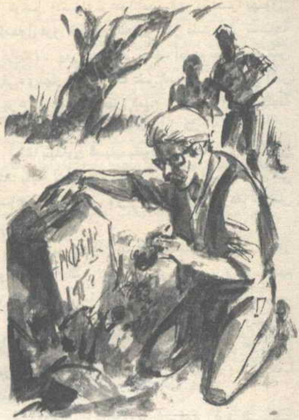
وجدنا جزءاً من جدار كتب عليه اسم (مينوس) ..

تسألني عن كنه هذا الكشف .. وعن العلامات التي أنذرتنا به .. أقول لك إن جميع الدلائل توحي بهذا : ١ - المنطقة التي نعمل بها في ( كنسوس ) لها تاريخ حافل حقاً . ٢ - يتحدث الأهالي عن ( شيء ما ) يحدث هنا . ٣ - وجدنا على حدود المنطقة أكثر من لوحة حجرية كتب عليها حفراً : ابتعد عن هنا أيها الغريب .. وكان جميعها مدفوناً تحت أطنان من الغبار . ٤ - وجدنا جزءاً من جدار كتب عليه اسم ( مينوس ) ، وهو ملك أسطوري لـ ( كريت ) لا نعرف عنه شيئاً إلا من الأساطير الإغريقية . ٥ - هذه المنطقة بكر تماماً ، ولم يعيث بها معول الباحثين على النقيض من باقى أجزاء ( كريت ) . التي تحولت إلى مزار للأرانب البرية من كثرة الحفر . والآن تم اتخاذ القرار بأن نبدأ الحفر في منتصف القطاع تماماً .. عند مركز الدائرة التي تنتشر اللافتات على حدودها .. وبدأنا العمل في يوم قانظ .. يوم من تلك الأيام التي تشعر فيها بأن الحر يحرق روحك ، ويبخر الهواء من رنتيك قبل أن تتنفسه ..