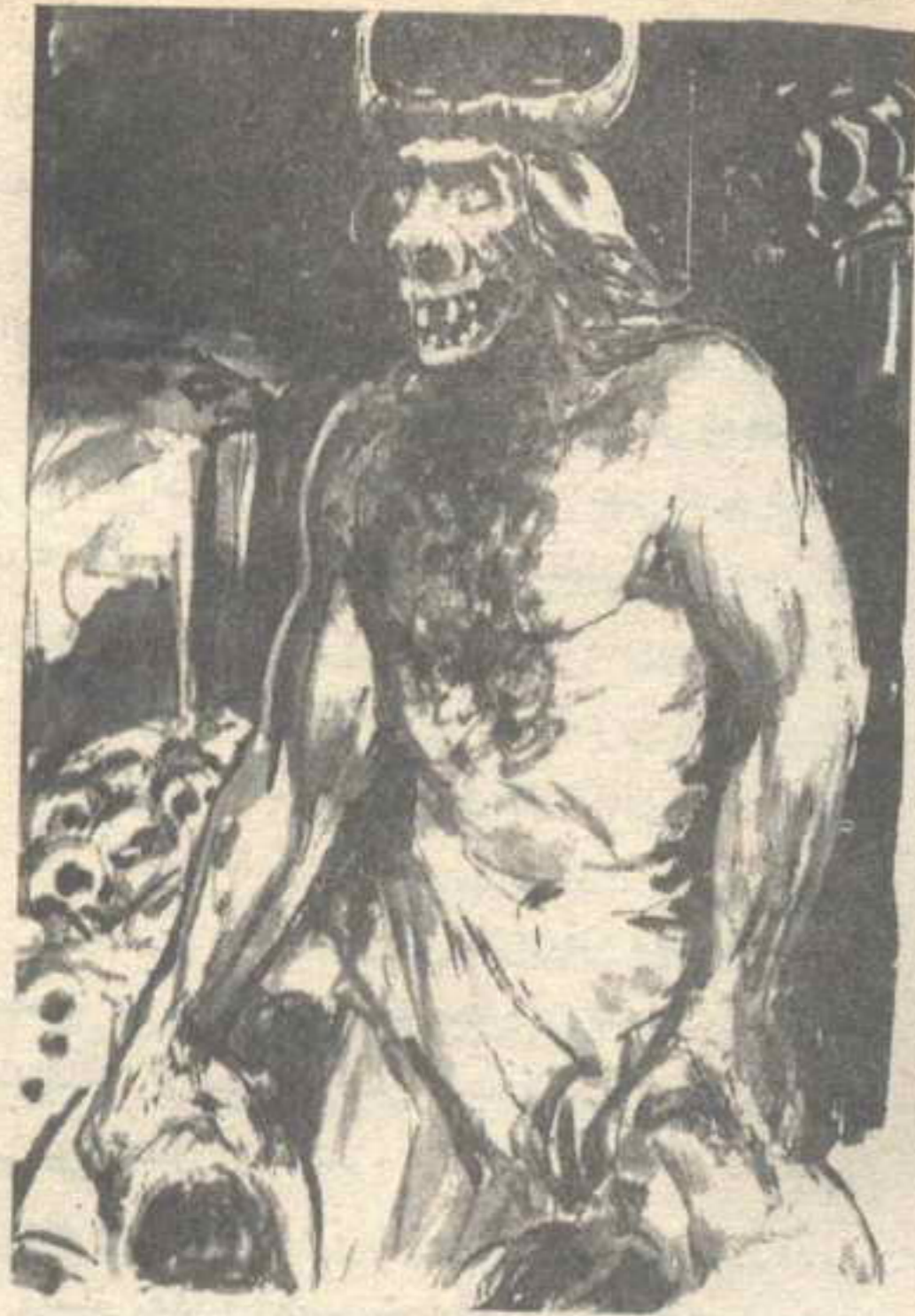
المهم أنه كان مزعجًا ومرعبًا .. وكان يقتل كل من يدنو منه ..

تذكر الأساطير الإغريقية لـ ( ديدالوس ) إنه هو أول من حاول الطيران في التاريخ ، مستعملًا جناحين من شمع .. وللأسف جرب هذا مع ابنه ( إيكاروس ) .. ولقد انتاب الحماس هذا الأخير حتى أنه دنا من الشمس أكثر من اللازم .. وذاب جناحاه ليهوى غارقًا في المحيط .. كما يذكر لـ ( ديدالوس ) أنه هو من بنى ( اللابيرنث ) أو ( المتاهة ) في ( كريت ) .. وهو الحل السعيد الذي وجده الرجل للتخلص من كارثة بيولوجية حطت على هذه الجزيرة ..