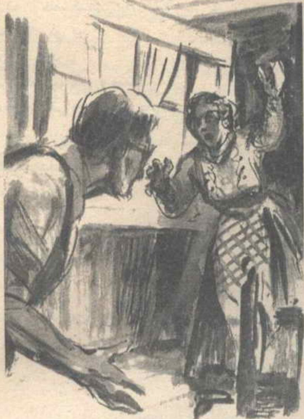
هرعت كالمسوع خارجاً من الغرفة لأنقذها ..