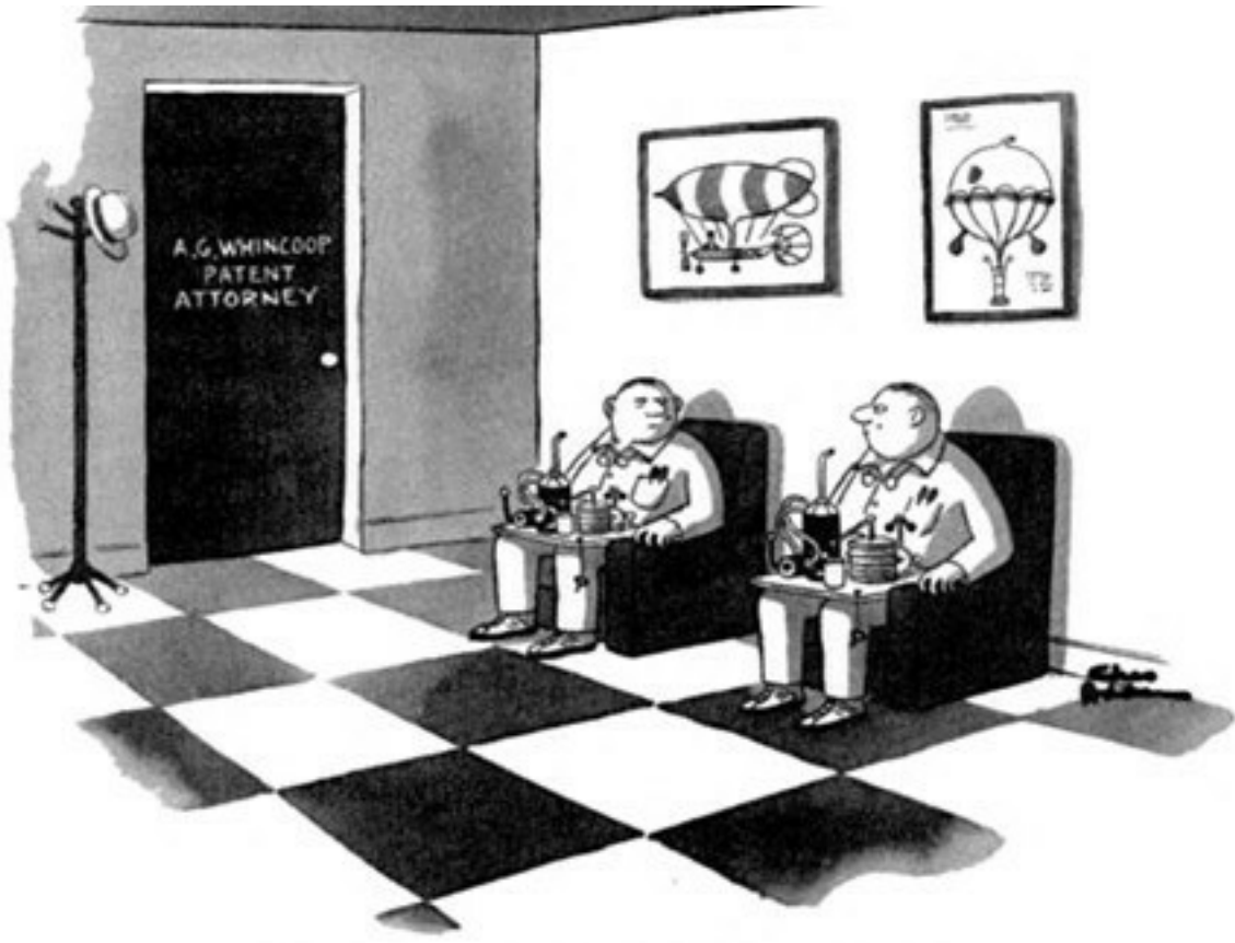
Separated at birth, the Mallifert twins meet accidentally.

فإذا كان الذكاء عاملاً جينياً متوارثاً، فذلك يقودنا للإيمان (مثل ما آمن غالتون) بأنه مثل الطول ولون الشعر، فإن الذكاء كمية مُحددة لا تتغير. هذا المنظور الحتمي يقودنا للتفكير بأن المرء ذو الذكاء المتدني يجب أن لا يُلام على ما هو فيه، فقدرة مختوم ومحتوم بما وُلد عليه. وبإمكاننا أن نجد رواسب هذا الاعتقاد في الكاريكاتير الشهير الذي نشرته مجلة النيويورك عام 1981م، من عمل الكاريكاتوري تشاس آدمز، إذ قدم لنا نسخة من العلاقة بين الجينات والسلوك في صورة الكاريكاتير الشهير "توأم ماليفرت"، والذي يُصوّر لنا توأمين متماثلين افترقا عند الولادة ولم يعرفا بعضهما يوماً، وبعدها بسنين التقيا في مكتب محامٍ كي يوثقا اختراعهما المتطابق!