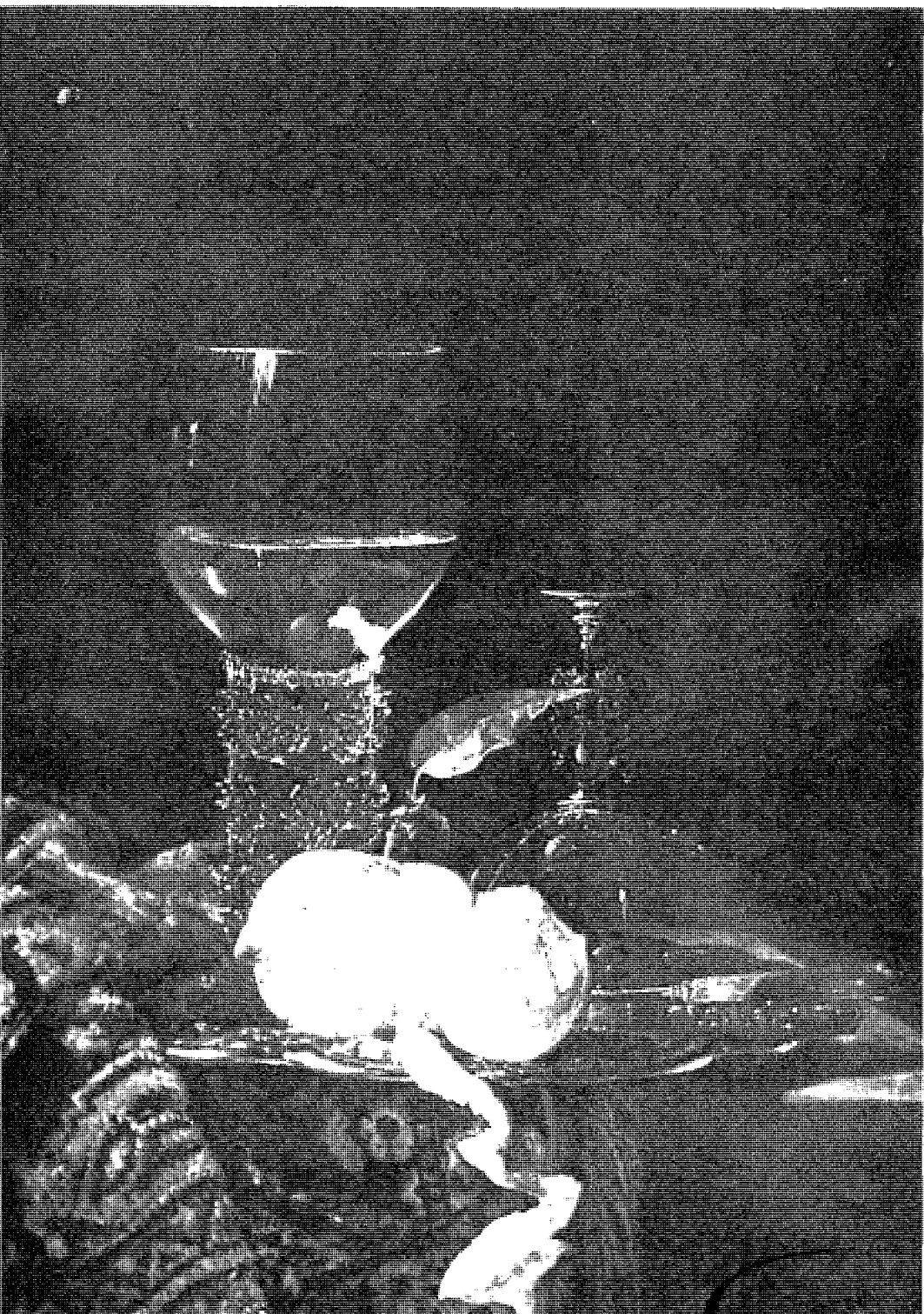
• نموذج لتصوير الليمونة المنزوع نصف قشرتها •