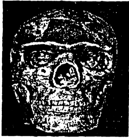
بشر سايبان من مائة وثلاثين ألف سنة