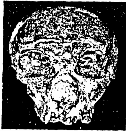
بشر نياندرتال من مائة وعشرين ألف سنة