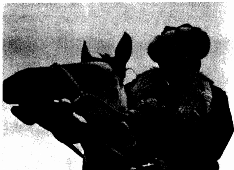
جنکيز ايشماتوف مع شغيلة الريف القرغيزيين