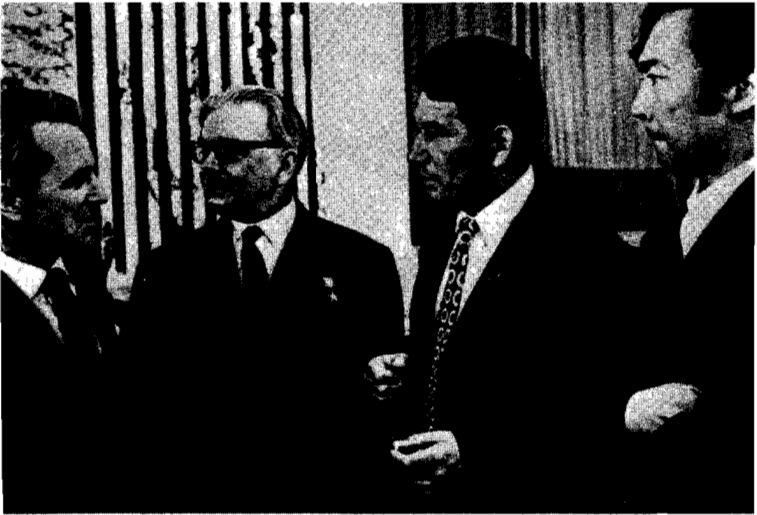
مع الكاتين التركمانين بيردى كيربايف (الى اليمين) وك . سيتليف . حديث مع جيمس اولدريج (الى اليسار) وليونيد ليونوف واولجاس سليمانوف (كازاخستان) في اعقاب المؤتمر الخامس لانهاد الكتاب السوفييت .