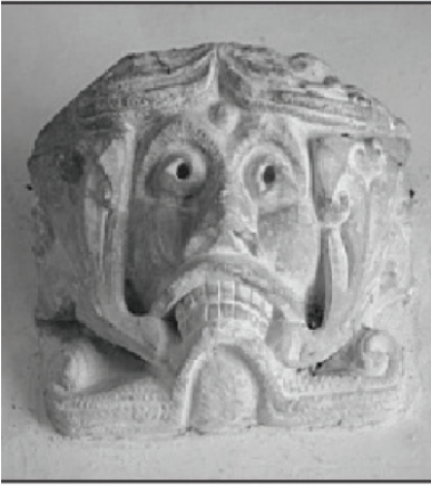
الصورة 2-7

أم أنهم كانوا يحلمون ويتصورون أمثلة موجودة في أعماق نفوسهم، ثم نقلوها لكل من كان يستمع إليهم؟