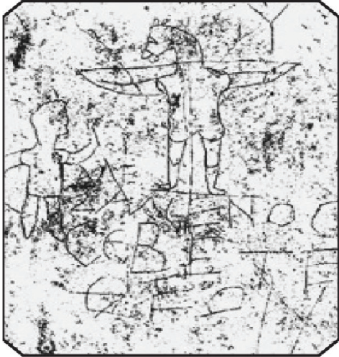
الشكل 2-2: كتابة وثنية على الجدران تعود للقرن الثاني وتصور رجلا يعبد حماراً أو بغلاً مصلوباً، مع نقش الكسمينوس يعظم «الإله» عشر عليها في متحف بلاطين هيل بروما، إيطاليا.

تنحدر كلمة «غرافيتي» في أصلها من اليونانية (graphein) وتعني «الكتابة» وتقابلها في الإيطالية (graffiato) أي «خدش»، وهو الأسلوب الذي كان يستخدم في أغلب الأحيان على جدران المعابد القديمة والقبور والحجارة القديمة والأعمدة. ويعود أقرب مثال قديم ومعروف عن الكتابة على الجدران إلى القرن الثامن قبل الميلاد، واكتشفت في قبر في خليج نابولي بإيطاليا، وهي تتألف من نص يوناني عشر عليه على متن سفينة تعرف باسم (نيستور كاب)، كما اكتشفت الكثير من الأمثلة من الكتابة على الجدران في الحفريات