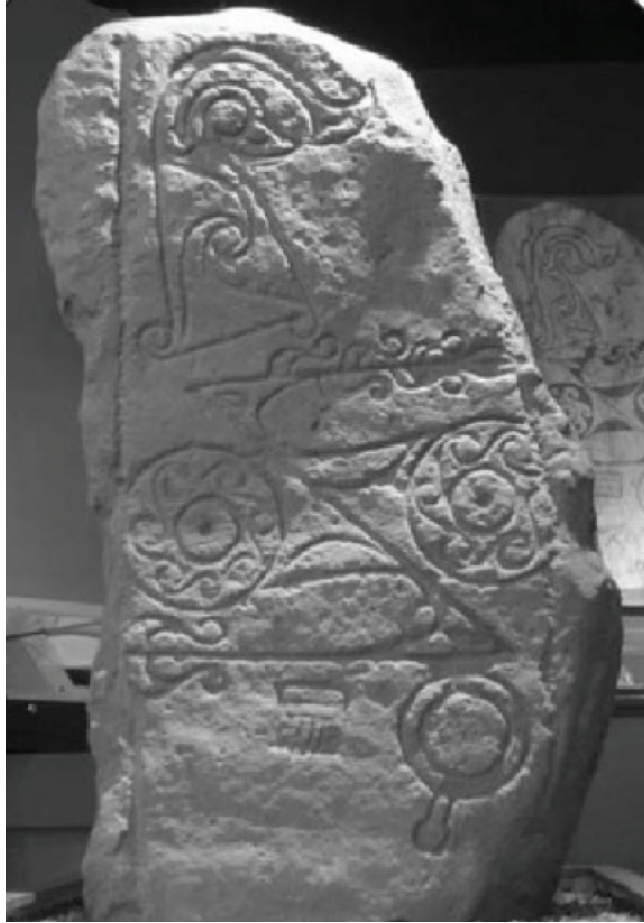
الشكل 2-3: حجر بكتيس من الصنف الأول يتضمن رموزاً منقوشة، وجد في دانتشان، أنجوس، اسكتلندا، وهو مثال عن الفن الصخري بالقرن الوسطى.

وتقع في الجزء العلوي من الصخرة والجدران، قيل إن تلك اللوحات كانت عبارة عن عمل فني (للميمي)، وهي كيانات رقيقة وحساسة تشبه القضيب عاشت في شقوق التضاريس الصخرية وزواياها. كما علّمت الميمي السكان طرق الرسم والصيد والموسيقى، وكانت ترسم في أغلب الأحيان أثناء الحركة والرقص والصيد والقتال والجري.