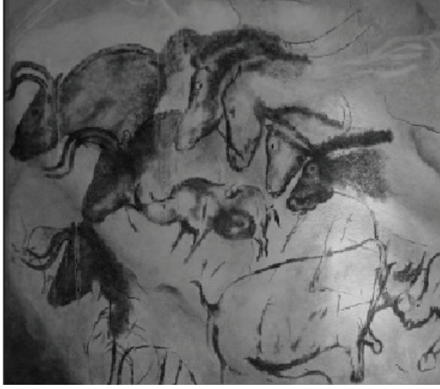
الشكل 2-1: صورة طبق الأصل من رسومات تعود إلى

الحجري القديم الأعلى الأوروبي) رغم أن فن الكهوف يُعد أقدم من ذلك بكثير في المجمل. ولحسن الحظ أغلق الكهف في وجه السيّاح للحفاظ على ما قد يمثل الصورة الرمزية المستخدمة في طقوس «الصيد» الشامانية والدينية. (وسناقش استخدام هذا الرمز والطقوس في فصل لاحق).