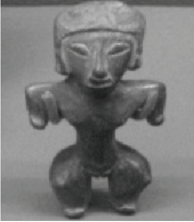
الصورة 1-7

لذلك من الممكن تحقيق قفزات هائلة في مجال العلوم والهندسة المعمارية والطب والفن وكل الأشياء الجيدة الأخرى حتى في ظل ثقافة متخلفة جداً في العموم. وعند فهم ذلك، فإننا نسأل مرة أخرى: هل وجود الكائنات الأجنبية ضروري لتحقيق قفزات كبيرة في النمو والمعرفة؟ هل كنا قادرين ببساطة على تحقيق ذلك بمفردنا عبر القبول بالأفكار المحتملة والمطروحة أمام كل واحد منا يتحلى بالشجاعة الكافية للتفكير خارج المألوف؟ جميع هذه القصص والصور التي تبدو لكائنات غريبة ترتدي خوذة وتعتلي مركبات غريبة تندفع مدوية في السماء، هل شهد أسلافنا