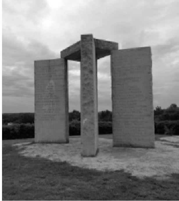
الصورة 1-5: الأحجار الدليل بجورجيا.

أجل بلوغ «عصر العقل». ووضعت الحجارة بطريقة تمكن من وصف الانقلاب الشمسي في الشتاء والصيف. وهي تتكون من صخور عظيمة، ومثل استخراجها ونقلها ورفعها إنجازاً هندسياً مذهلاً حتى بالمقاييس المعتمدة اليوم!