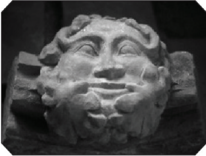
الشكل 3-2: نحت الرجل الأخضر بدير سسترسن، دير دوري.

النباتات. وعلى الرغم من أن المصطلح قد صيغ في الواقع سنة: (1939م) في مقال نشر في مجلة الفولكلور، كان الرجل الأخضر أو جاك الأخضر، فكرة متداولة على نطاق واسع ورمزاً للخصوبة الوثنية أو روح الطبيعة التي مثلت ولادة جديدة لدورة الطبيعة كل ربيع. وقد ظهرت أفكار الرجل الأخضر منذ أكثر من 400م.