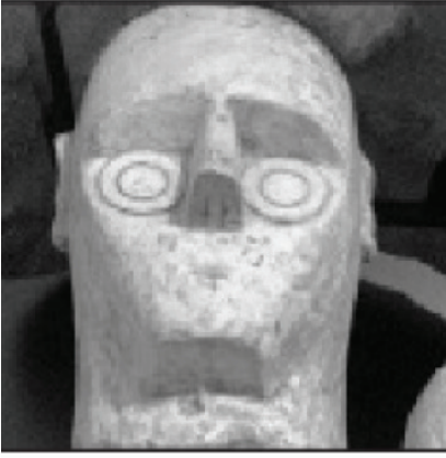
الصورة 7-3

وإذا سألتنا عن موقفنا، فإن السبيل الوحيد للمعرفة على وجه اليقين هو اختراع آلة للزمن، تعود بالوراء آلاف السنين لننظر بأعيننا. عندما يصبح ذلك ممكناً، سأكتب عنه كتاباً. (انتظر ثانية واحدة. فنحن نتظر بدورنا!)