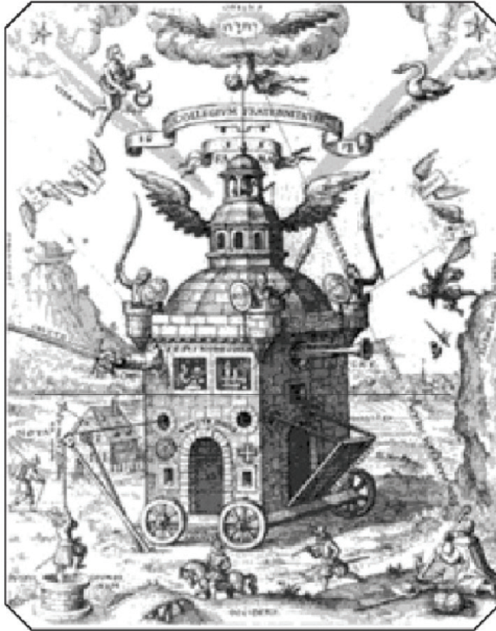
الصورة 2-6 : معبد الصليب الوردي رمز قوي لنظام الصليب الوردي. وتعود هذه الصورة إلى 1618، (تيوفليس شويفار كونستونتيان)

تكون وراء الاهتمام الكبير بالخيمياء. وشهدت فترة تنوير روزيكروشن، التي امتدت ما بين: 1614 و 1620 للميلاد، ظهور مئات الكتب والوثائق التي تأثرت تأثراً كبيراً بالروسيكروسيانيسم (الصليب الزهري) أو بنقدها. ورغم ادعاء العديد من الأعضاء بأن تنظيمهم أقدم من الماسونية في إشارة إلى الرتبة 18 من طقوس الماسونية الإسكتلندية التي تسمى فارس روزكروا كدليل على ذلك، إلا أنه لم يتم التحقق من صحة مزاعمهم إلى اليوم. ورغم ذلك تلتقي المجموعتان في بعض القواسم المشتركة، بما في ذلك مراتب الانتساب أو العضوية.