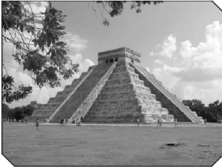
الصورة 5-3 : (المصدر: إريكس كوفاروبياس)

هل كان مجرد الحب المتأصل في طبيعتنا البشرية للأشياء الهرمية الشكل هو الذي دفع بمثل هذه الصروح في جميع أنحاء العالم، أم أنه فهم عام لقوة الشكل نفسه باعتباره رمزاً للقوة عندما تنتقل من الأسفل إلى الأعلى، لتنتقل وتبلغ أقصى الكون أو العكس بالعكس؟