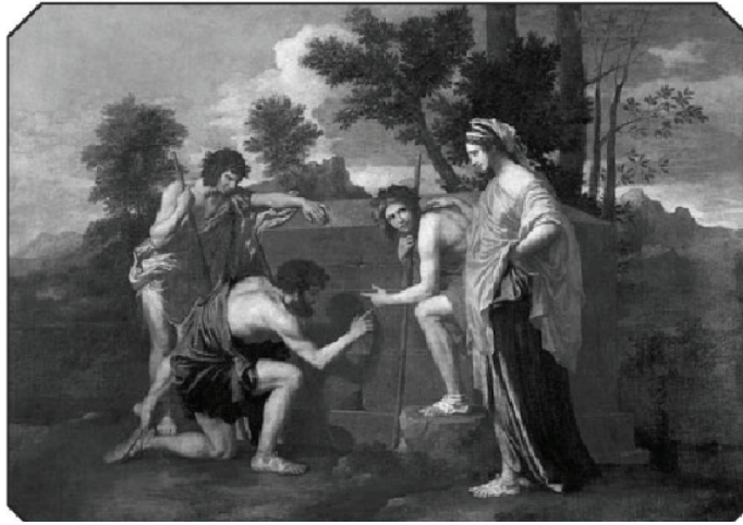
الصورة 1-6 : شيبيرد أركاديا بواسطة نيكولاس بوسين. يقال إنه يتضمن رموزاً وإشارات سرية إلى حيث يقع قبر المسيح.