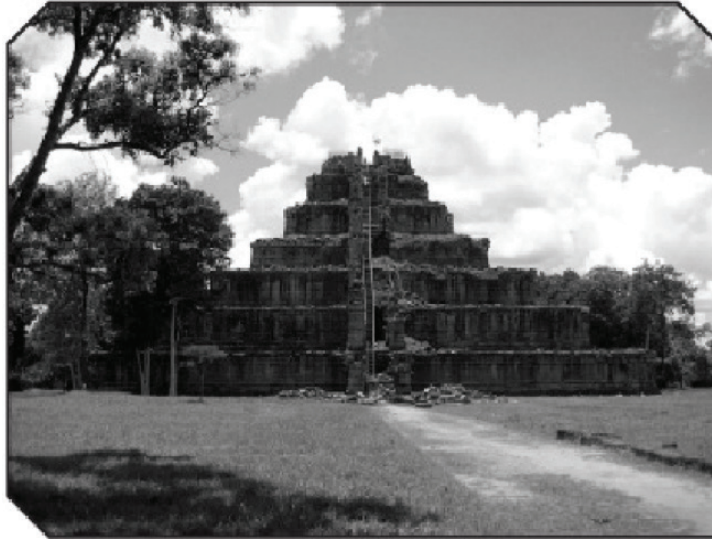
الصورة 5-2 :

صدقوا أو لا تصدقوا، لقد عُثر على العديد من الأهرامات في اليونان أيضا وعددها 16 لكنها لا تحظى باهتمام كبير. ومعظمها عبارة عن صروح تذكارية للجنود الذين لقوا حتفهم في المعارك. وتحول 14 هراماً منها إلى خراب، رغم العثور على هرمين سليمين بالكامل في كل من هلينيكو وليغوريو.