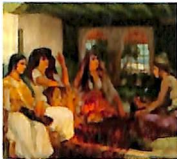
Frederick Arthur Brigdman (1847 - 1928) Femmes dans un intérieur oriental

وقد حاولنا أن نستل هذه النظرة من العهد القديم بوصفه نصا مركزيا ومؤسسا من غير تقويل منا إياه أو تقول عليه، بما يجعل هذا الكتاب الذي بين يديك مقاربة جادة وجديدة تقطع مع الصور النمطية التي رسمتها الذاكرة الجمعية للمسلمين عن اليهود، وتسعى إلى بناء صور بديلة جديدة ومنصفة.