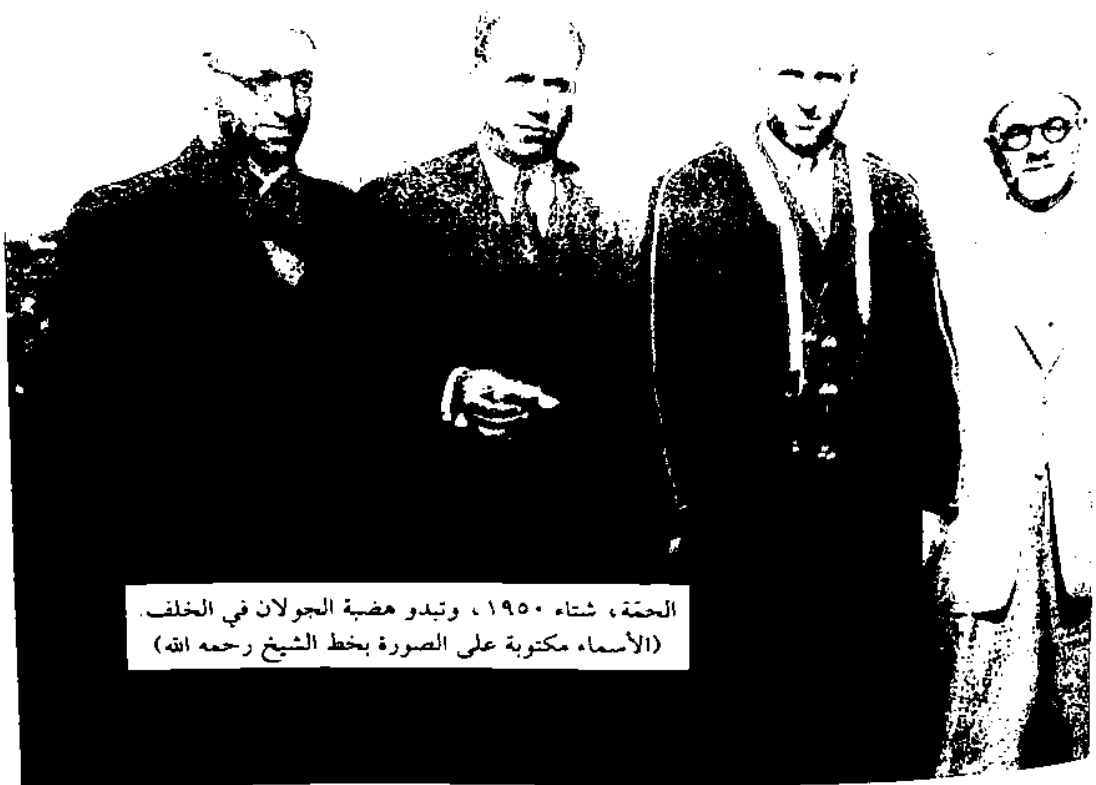
الحقة، شتاء ١٩٥٠، وتبدو مضية الجولان في الخلف. (الأسماء مكتوبة على الصورة بخط الشيخ رحمه الله)