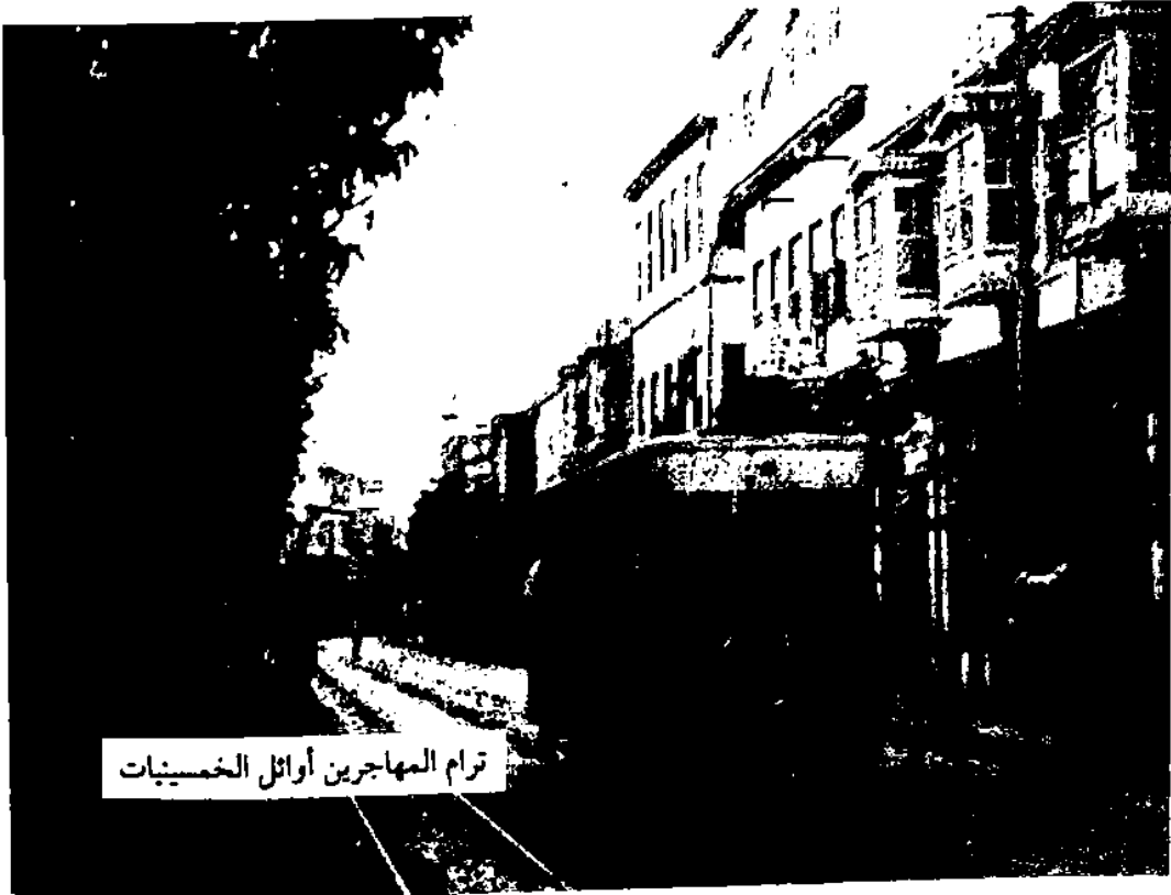
ترام المهاجرين أوائل الخمسينيات

ووصل إلى الحميدية، وكان الناس ينتظرون في وسط الطريق (لأنه ليس للترام محطات لها رصيف كما هي المحطات في مصر وكما تكون في كل بلاد الناس)، فأقبلوا ليركبوا، فنقل الكمساري الباب ورفع الدرَج وقال: دوروا من الجهة الأخرى. فلما ذهبوا ليدوروا مشى الترام، فتعلق بعضهم وركض بعض، فكادت تسحقهم السيارات، وامتلاء الترام حتى لم يبق فيه مكان. ومشى، فلما وصل إلى المرجة إذا أمام العدلية حشد من الناس