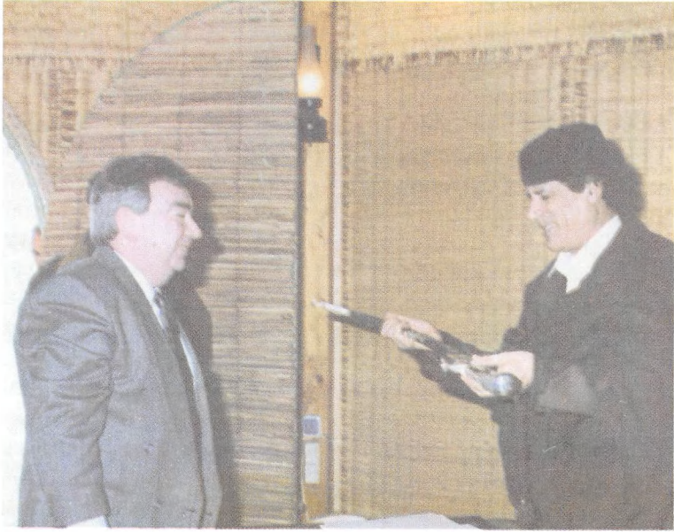
خنجر هدية من القذافي.