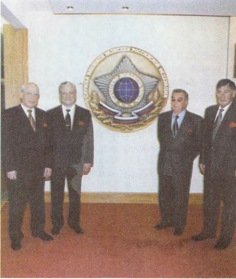
أربع رؤساء للاستخبارات الخارجية الروسية من اليمين لليسار: ل.ف. شيبيراشين، ي.م. بريماكوف، ف.أ. تروبنيكوف، س.ن. ليدوف.