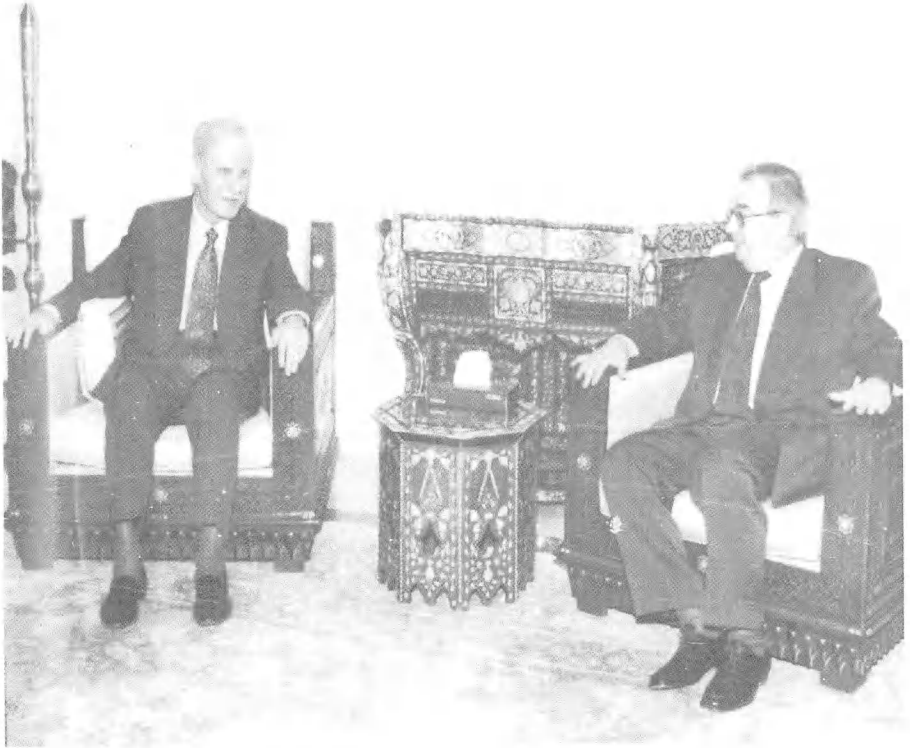
جلسات متواصلة مع رئيس سوريا حافظ الأسد.