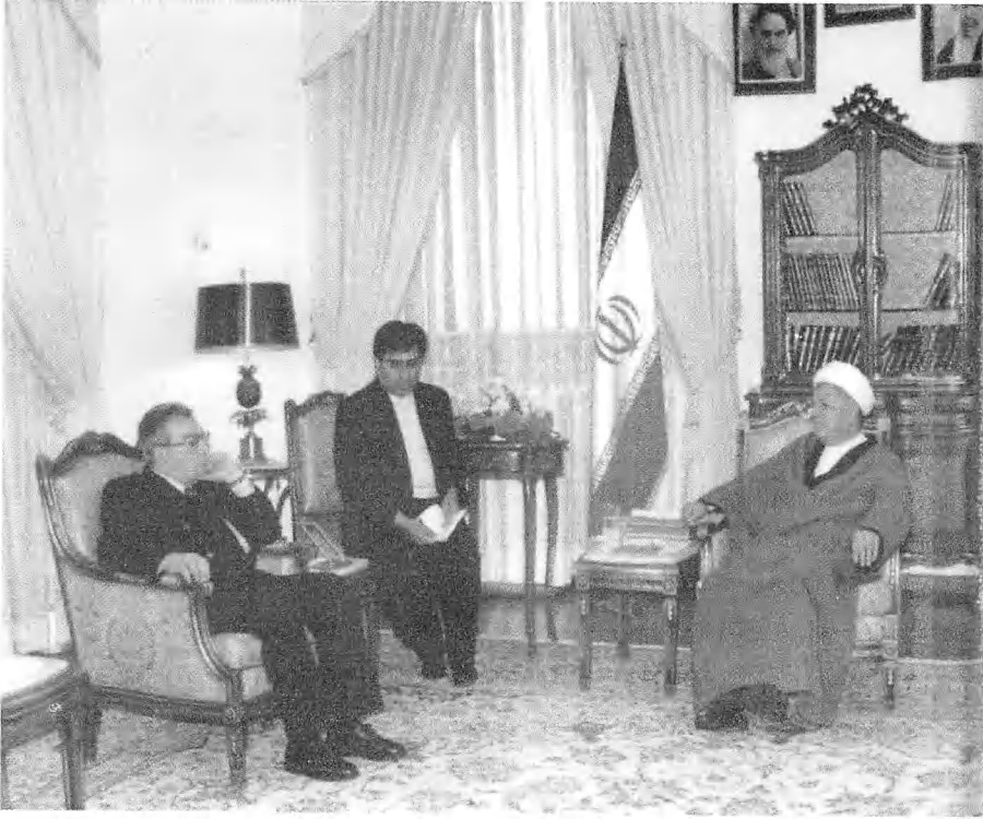
مع رئیس ایران رافسنجانی.