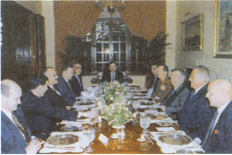
الأردن عند الأمير حسن (الثالث من اليسار)