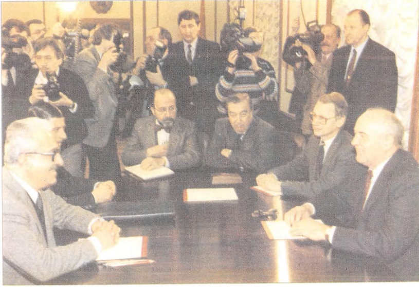
محاولة وقف عملية الولايات المتحدة في الكويت اللقاء بعد منتصف الليل يوم ٢٢ فبراير ١٩٩١ في الكرملين مع طارق عزيز (الأول من اليسار) الذي وصل بدون تفويض.