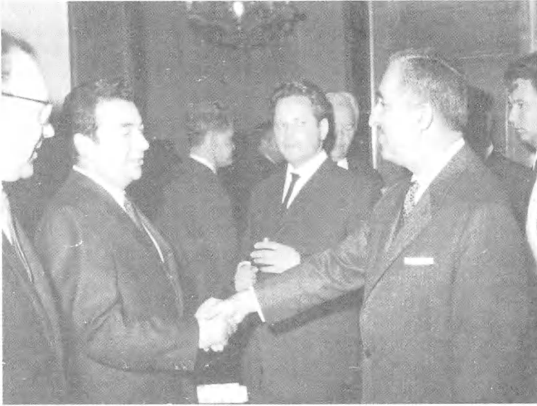
مع رئیس وزراء لبنان رشید کرامی.