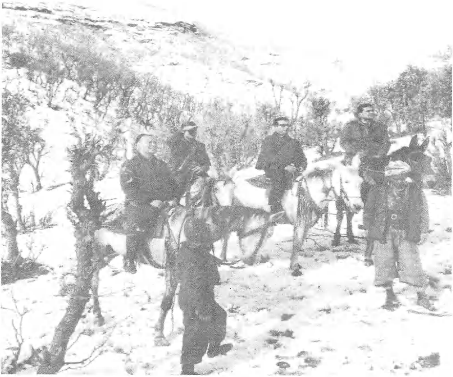
على البغال فى المقر الشتوى للبرزانى.