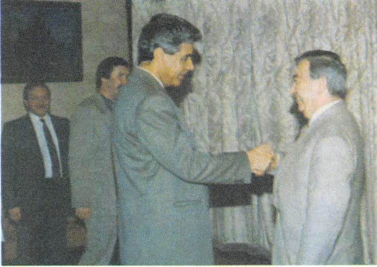
رجل ليبيا القوي، رئيس المخابرات موسى كوسا.