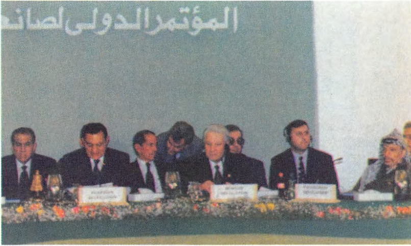
المؤتمر الدولي لمكافحة الإرهاب في الشرق الأوسط ، عقد في شرم الشيخ، رؤساء الوفود: حسنى مبارك، ب.ن. يليستين، ياسر عرفات.