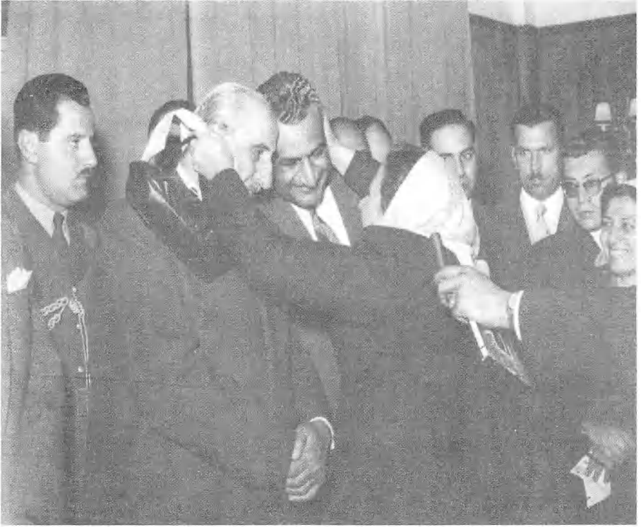
شعبا مصر وسوريا استقبلا بالفرح قيام الجمهورية العربية المتحدة.