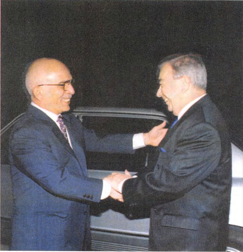
مع ملك الأردن حسين، كانت تربطني به صداقة قوية.