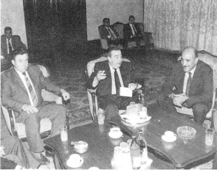
مع اللواء عمر سليمان، مدير المخابرات العامة المصرية. الجلسات معه وضحت أموراً كثيرة.