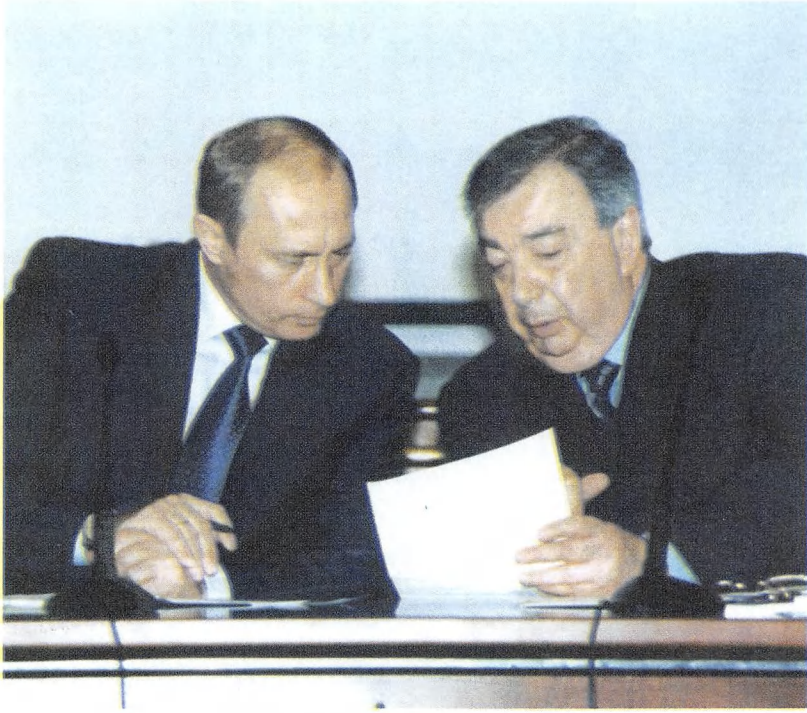
تكليف من الرئيس بوتين: بالسفر إلى بغداد.