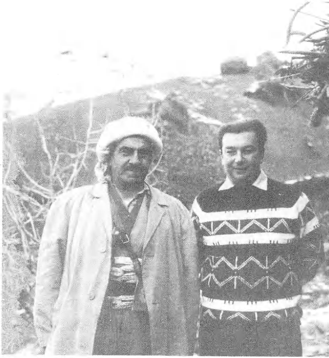
الملا مصطفى البرزاني - قائد حركة التحرر الوطني الكردية.