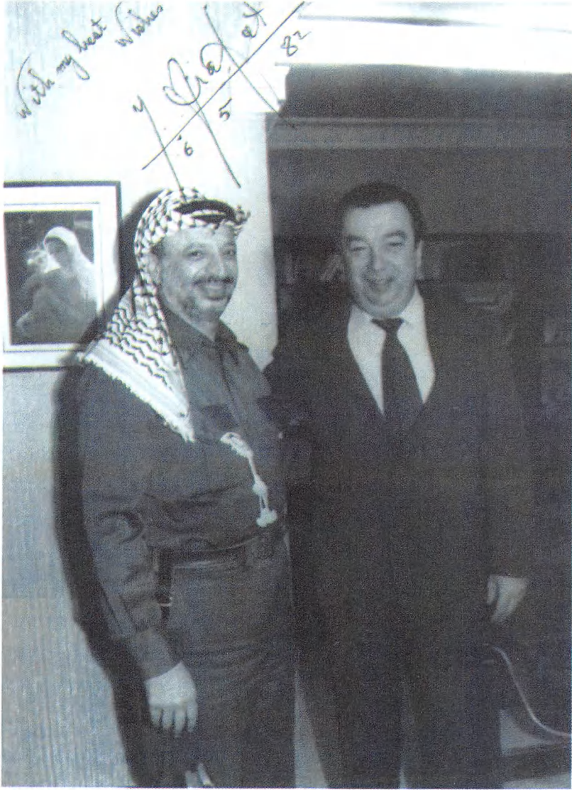
أحد اللقاءات الودية مع ياسر عرفات.