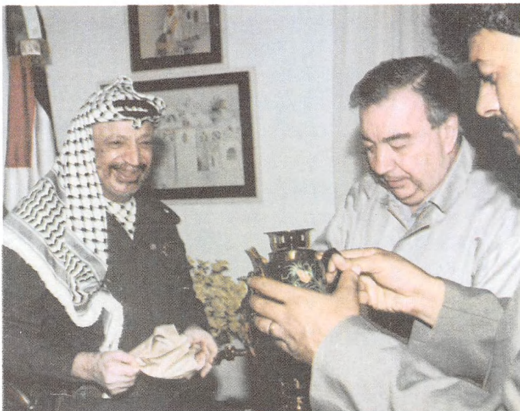
سيمفاور هدية تذكارية لأبى عمار.