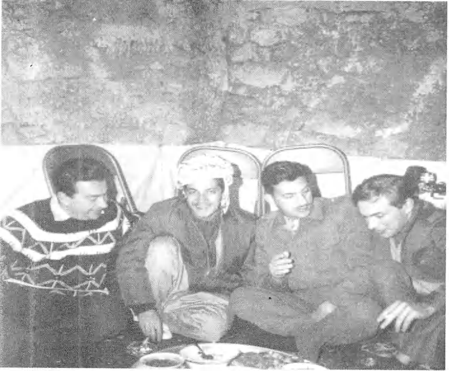
نجل البرزاني مسعود (الثاني من اليسار) - قائد الحركة الكردية في العراق، حينها عام ١٩٦٦، في عامه السابع عشر كان مديرا لمحطة الراديو.