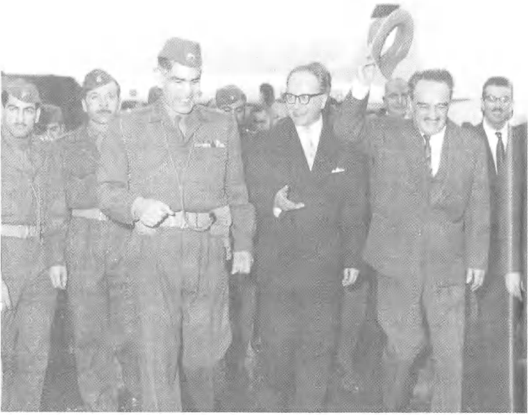
أ. إى. ملكويان وعبد الكريم قاسم، محاولة فاشلة لإيجاد "بديل" لناصر.