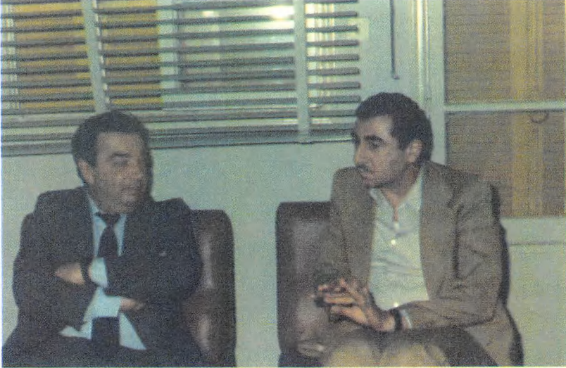
قائد الجبهة الديمقراطية لتحرير فلسطين نايف حواتمة لقاء في بيروت.