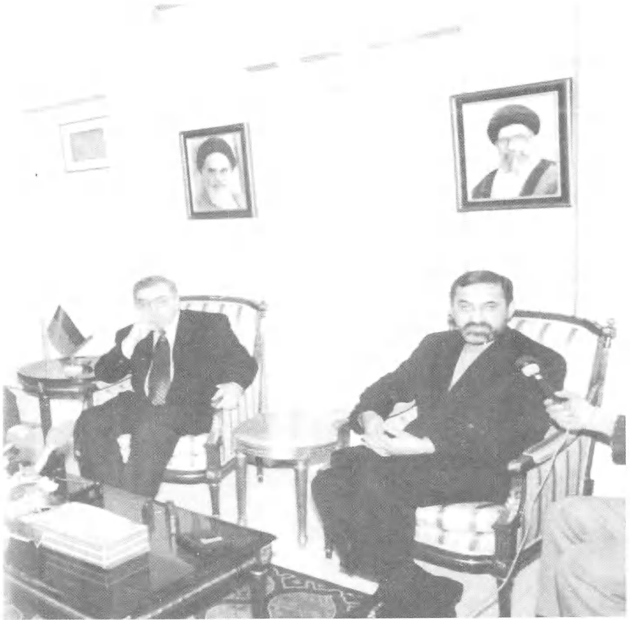
وزير خارجية إيران ولاياتي، الكثير في لبنان كان يعتمد عليه.