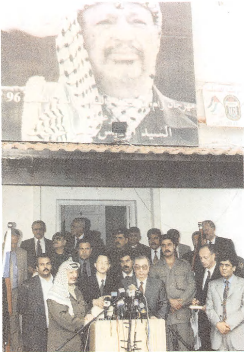
لقاء حافل لوزير خارجية روسيا في غزة.