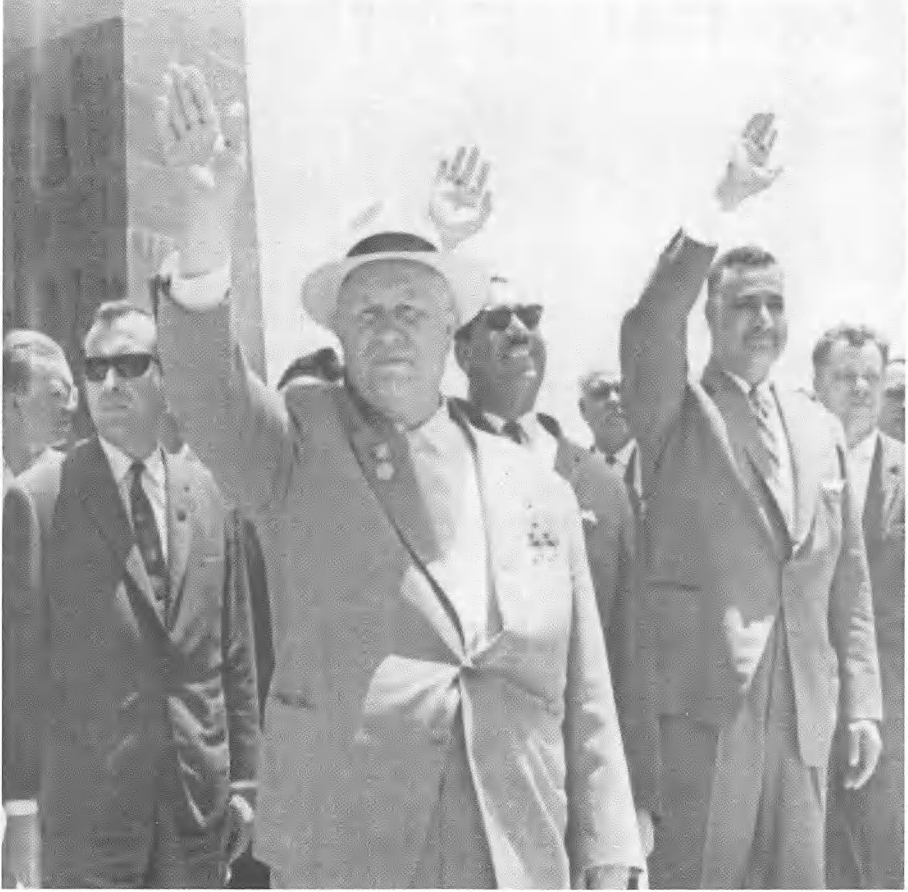
ن. س. خروشوف وجمال عبد الناصر، مصر تصبح حليفة.