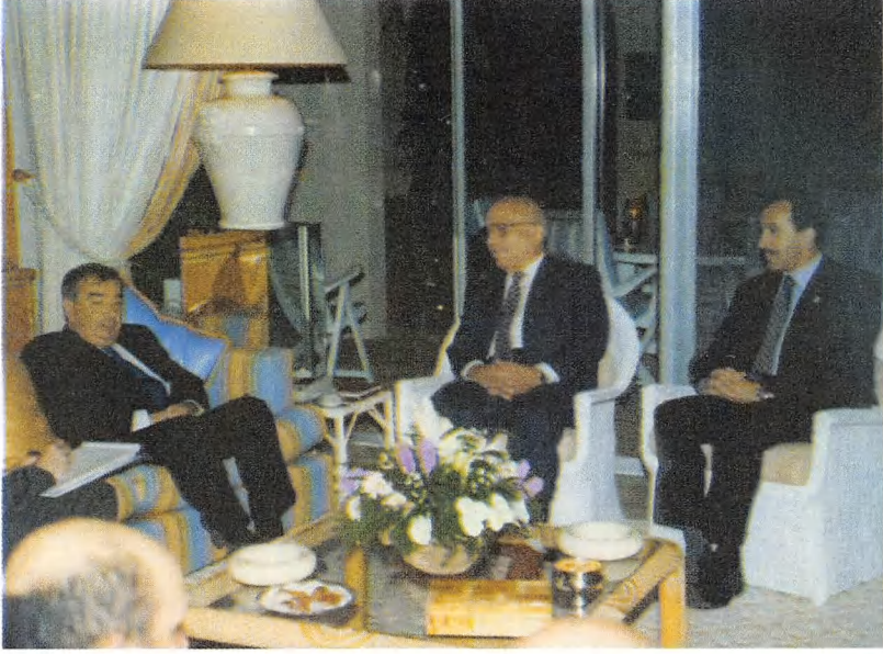
مع الملك حسين