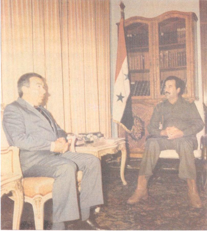
مع صدام حسين. كم هو غريب، كان يجيد الاستماع، لكنه يفعل ما يريد.