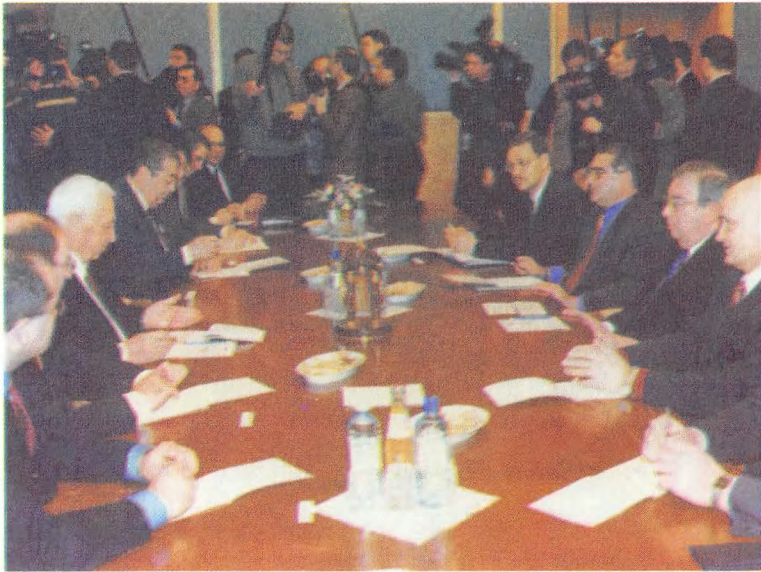
محادثات مع رئيس وزراء إسرائيل آ. شارون.