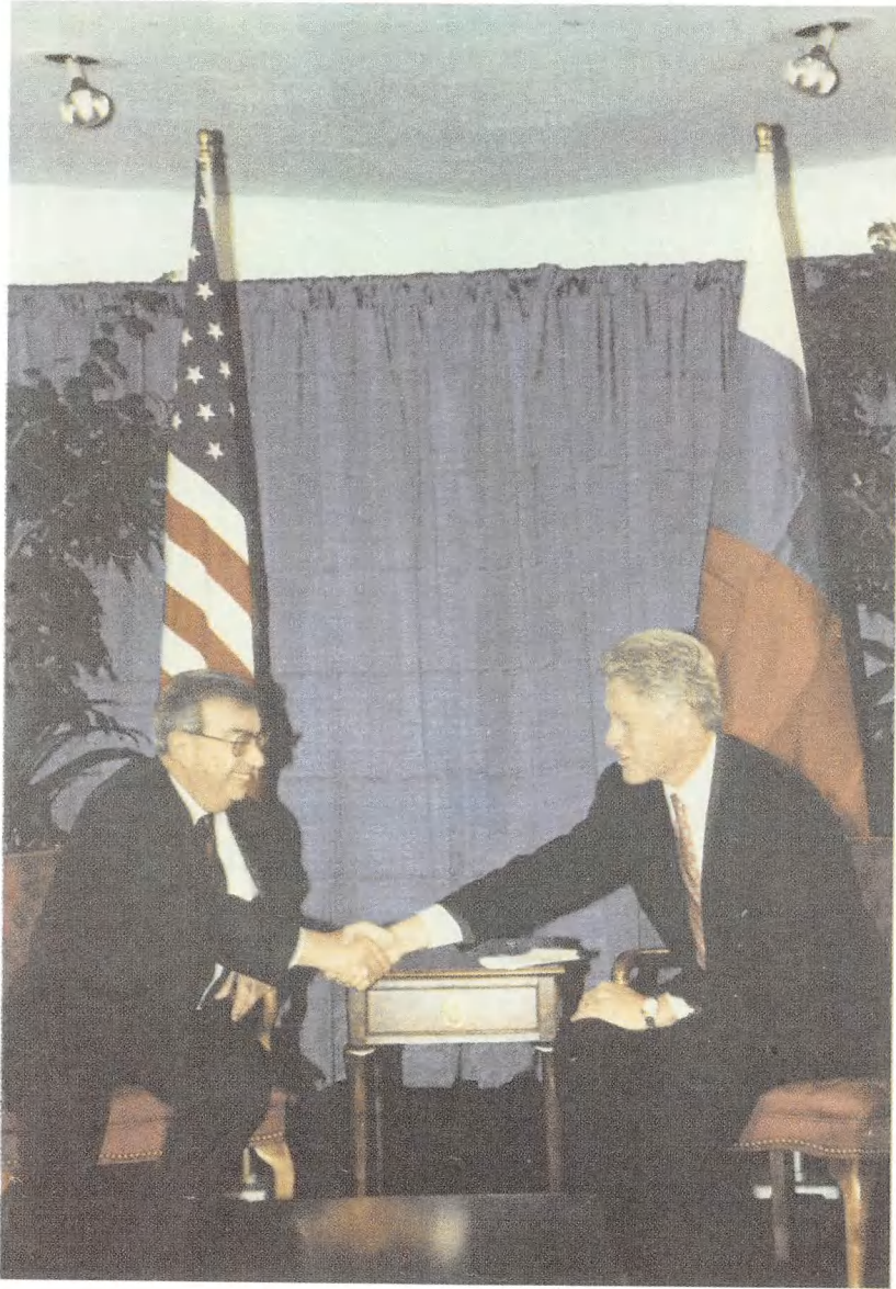
مصافحة مع رئيس الولايات المتحدة ب. كلينتون.