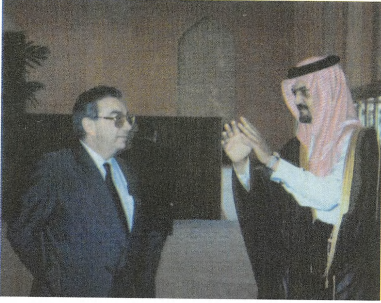
مع وزير خارجية العربية السعودية الأمير سعود الفيصل ، جدة