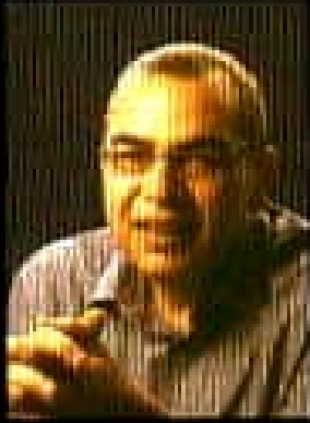
د. أحمد خالد توفيق