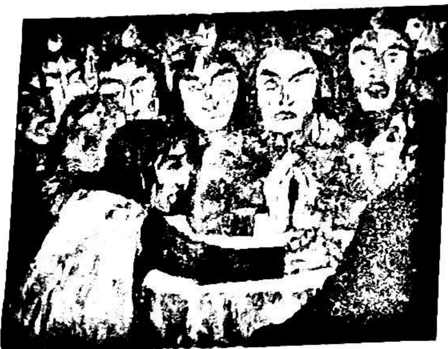
Emil NOLDE, La Pentecôte, 1909

تسعى هذه الحساسية جاهدة إلى التخفيف من حدة التقابل الذي أُرستهُ الحداثة بين العقلي والحسي. وقد اقترحتُ بديلاً عنه من خلال ما أسميته بـالعقلانية الفائقة قاصداً بها نمطاً معرفياً مازجا بين كل العناصر والمكونات التي درج العقل الحداثي على نعتها بالثانوية أو العَرَضِيَّة، وفي القلب منها العادي والمبتذل في حياة الناس، والوجداني وكل ما له صلة بالمظهر، وعناصر أخرى يختصرها مصطلح الجماليات.